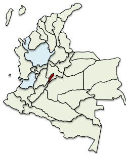
Convención Variación 2010/2000