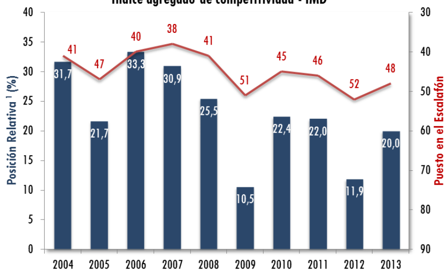
Gráfica 1. Evolución de la posición de Colombia Índice agregado de competitividad - IMD

1 Posición relativa: porcentaje de países superados por Colombia en escalafón de competitividad.