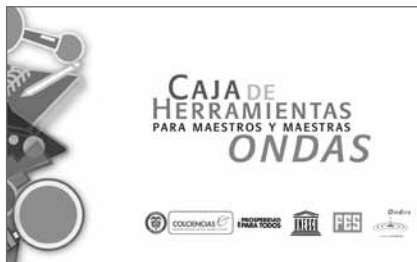
La estrategia de formación de maestros y maestras del Programa Ondas