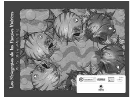
Los Navegantes de las Fuentes Hídricas