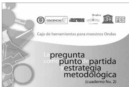
La pregunta como punto de partida y estrategia metodológica.