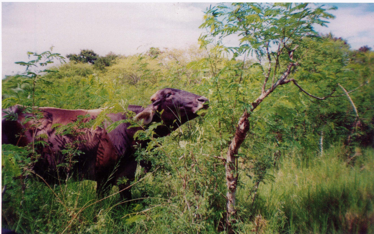
BOVINOS ALIMENTÁNDOSE EN UNA ASOCIACIÓN DE LEUCAENA Y PASTO ESTRELLA

para que allí se expresen y se presenten al sistema inmune de la misma forma como se realiza en una infección natural. No requieren del uso de adyuvantes e inducen respuesta inmune humoral y celular la cual es muy específica y de larga duración. Algunas de estas vacunas se encuentran en avanzados ensayos clínicos. 18