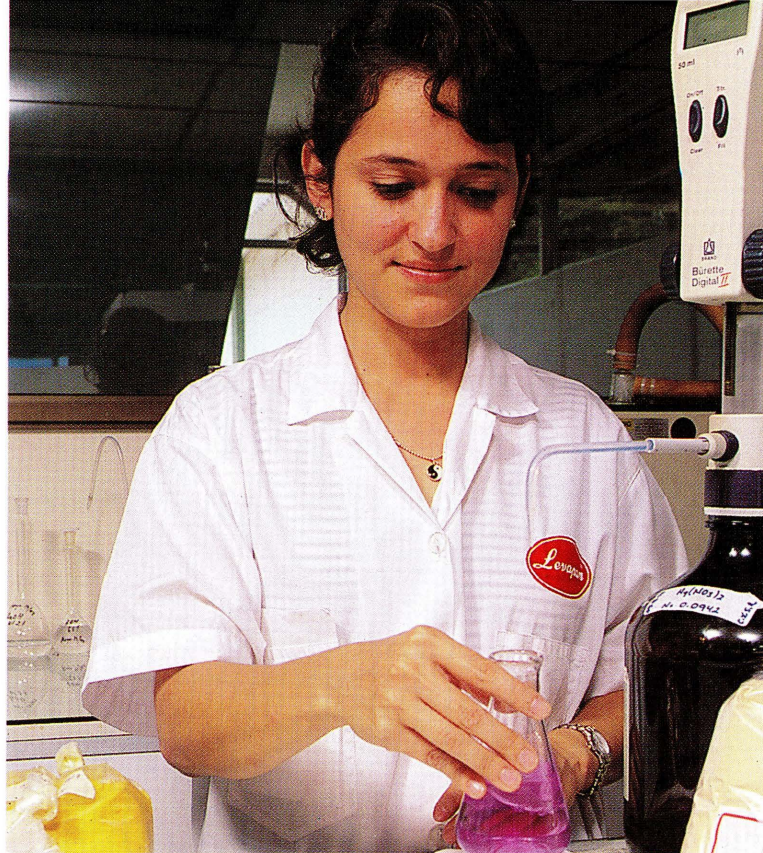
LA INDUSTRIA DE PROCESOS QUÍMICOS HA TENIDO CAMBIOS QUE SE DEBEN TENER EN CUENTA.

Si bien, el presente ensayo no es el resultado de un estudio riguroso en el que se hayan utilizado técnicas de previsión tecnológica y mucho menos una metodología integradora de indagación de futuro como el método de los escenarios, si recoge en un apretado esfuerzo sintetizador testimonios y conjeturas de otros autores, sobre los cambios que se vienen observando en la industria de procesos químicos e impactos que se esperan de algunos desarrollos tecnológicos que se están gestando en esta industria e industrias relacionadas. En el marco de este ejercicio prospectivo también se sugieren las bases para dos nuevos paradigmas que impulsarán el desarrollo y una nueva estructura del conocimiento de la ingeniería química en el futuro.