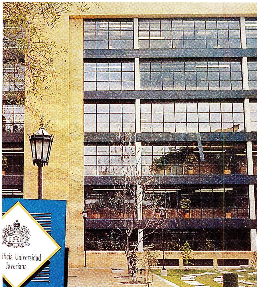
Pontificia Universidad Javeriana. Santaafé de Bogotá.

c. Los esfuerzos que se vienen adelantando en esta etapa para crear en las entidades de investigación entornos institucionales apropiados a las actividades de CyT, tienen que trascender rápidamente el marco de la creación de aparatos formales y concretarse en imaginar aquellas medidas más